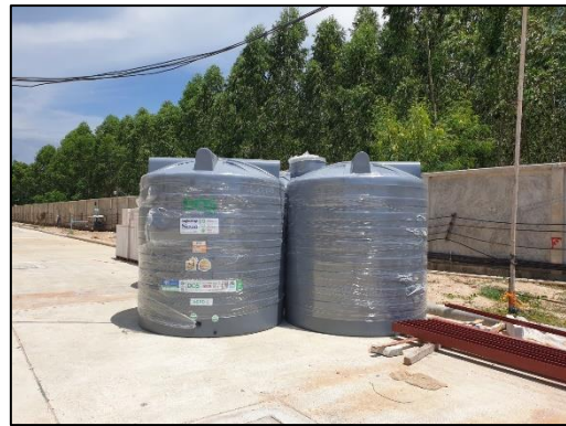
รูปที่ 3-4 ตัวอย่างระบบสำเร็จรูปหรือกึ่งสำเร็จรูป ให้มีการหล่อคอนกรีตในพื้นที่ก่อสร้างน้อยที่สุด