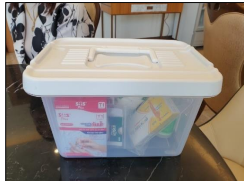
รูปที่ 3-15 อุปกรณ์ปฐมพยาบาลเบื้องต้น