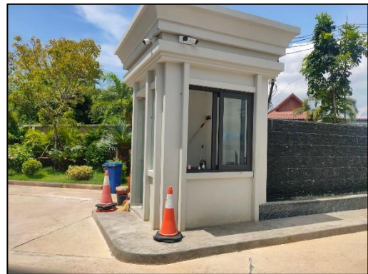
รูปที่ 3-14 จัดให้มียามรักษาความปลอดภัยตลอด 24 ชั่วโมง