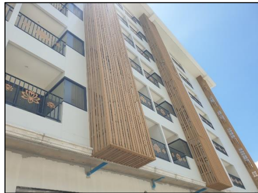
รูปที่ 3-10 ผนังอาคารจากพื้นจนถึงเพดานชั้นก่อสร้าง ทำหน้าที่เป็นกำแพงกันเสียง