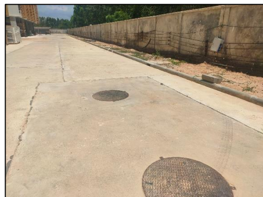
รูปที่ 3-11 จัดให้มีห้องน้ำ ห้องส้วม และระบบบำบัดน้ำเสีย