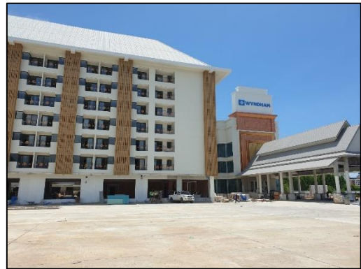
รูปที่ 3-6 พื้นที่โครงการไม่เก็บกองวัสดุที่อาจก่อให้เกิดฝุ่นในบริเวณพื้นที่ก่อสร้าง