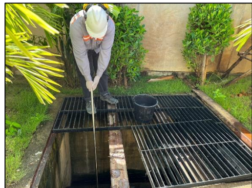
รูปที่ 3-13 บ่อพักน้ำทิ้งที่ผ่านการบำบัด