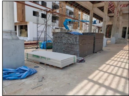
รูปที่ 3-1 จัดวางแผนและจัดระเบียบการเก็บกองวัสดุก่อสร้างเป็นสัดส่วน