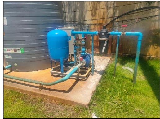
รูปที่ 3-12 จัดให้มีถังสำรองน้ำใช้ให้เพียงพอกับความต้องการ