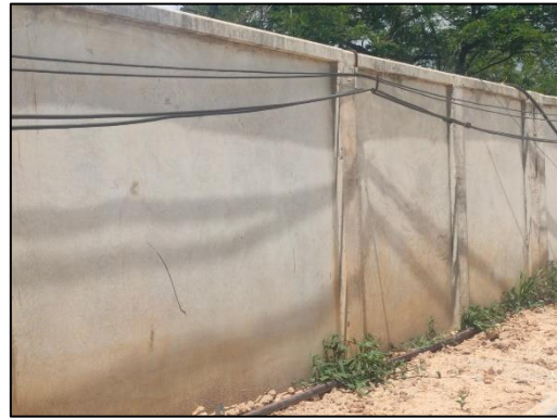
รูปที่ 3-9 ใช้รั้วคอนกรีตทำหน้าที่เสมือนเป็นกำแพงกันเสียง ติดตั้งที่แนวเขตที่ดินและใช้เป็นรั้วโดยรอบโครงการ