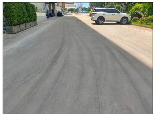
รูปที่ 3-2 พื้นที่โครงการมีความเป็นระเบียบเรียบร้อย