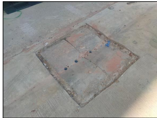
รูปที่ 3-5 ควบคุมไม่ให้มีปริมาณน้ำไหลและน้ำโคลนบนพื้นที่ก่อสร้างที่จะเกิดความผิดปกติ