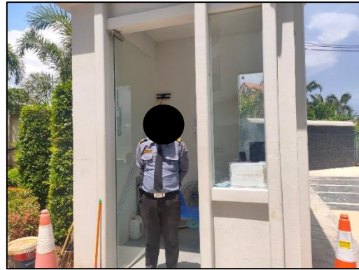
รูปที่ 3-3 เจ้าหน้าที่ที่เกี่ยวข้องคอยรับเรื่องร้องเรียนที่อาจจะเกิดจากการก่อสร้าง