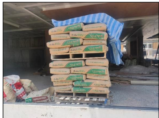
รูปที่ 3-7 เก็บปูนซีเมนต์ผงโดยบรรจุในภาชนะที่มิดชิด